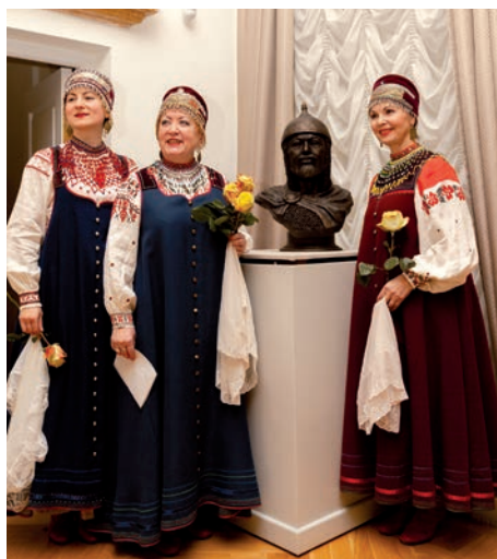
Театр народной песни «Узорочье»