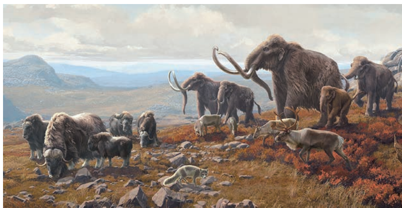
◀ На выставке будет экспонироваться уникальный артефакт – череп большерогого оленя из коллекции РИИМЗ

периоды похолоданий и потеплений, но менее масштабные. Мы живем сейчас в межледниковую эпоху, начавшуюся 11,7 тысяч лет назад. А одним из примеров незначительного похолодания в наше, в целом теплое время, являлся так называемый малый ледниковый период (XIV – середина XIX в.). После чего началось глобальное потепление, усиленное антропогенным влиянием.