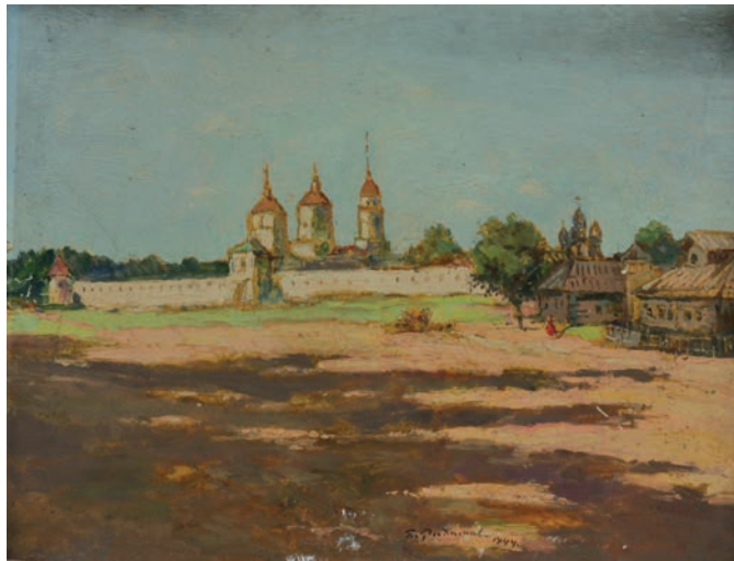
Павел Радимов. Общий вид Солотчинского монастыря. 1944 г.

о реалистическом искусстве, отражающем советский быт, который послужил началом большого советского общественного художественного движения АХРР (Ассоциация художников революционной России). Павел Радимов выставлялся на всех основных выставках советского искусства как в СССР, так и за границей.