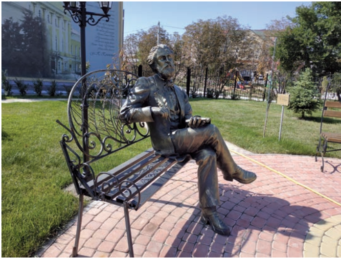
Памятник Полонскому в сквере рядом со зданием Первой мужской гимназии. Сейчас здесь располагается Рязанский филиал Московского политехнического университета