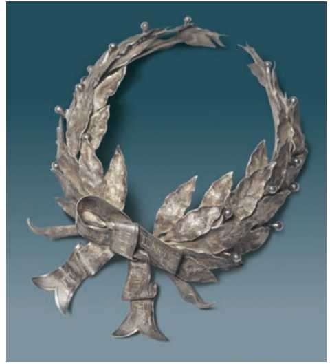
Серебряный венок, врученный Полонскому в честь 50-летия поэтической деятельности

В многочисленных воспоминаниях современников Яков Петрович предстает добрым и благородным человеком с по-детски непрактичным и мягким характером. Личность поэта повлияла на его творчество. Полонский писал и в стихах, и в прозе, но главнейшую его заслугу составляет лирика. Она невероятно музыкальна, поэтому многие стихотворения Полонского стали популярными песнями и романсами. На его стихи писали музыку Чайковский, Рубинштейн, Даргомыжский, Рахманинов, Танеев... Стихотворение «Песня цыганки» («Мой костер в тумане светит...») стало народной песней.