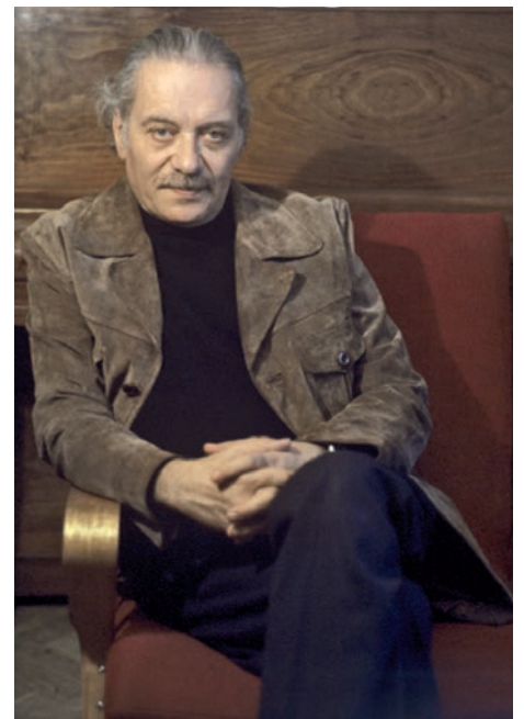
Автор диорамы Народный художник РСФСР Ефим Дешалыт

Что такое диорама? Это лентообразная изогнутая полукругом картина, натянутая по внутренней поверхности цилиндрического подрамника, которая сочетается с расположенным перед ней предметным планом (бутафорские и реальные предметы, сооружения). Если изображение дает полный круговой обзор, то это уже панорама. Долгое