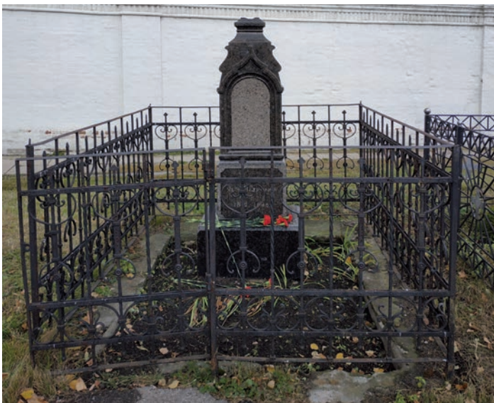
Могила Я.П. Полонского в Рязанском кремле

Последние годы жизни Якова Петровича были омрачены тяжелыми болезнями. 18 октября 1898 г. Полонский скончался. Незадолго до смерти поэт выразил желание быть погребенным на родине, в Львовском монастыре. В советское время на территории бывшего монастыря разместилась исправительно-трудовая колония, поэтому в 1959 г. прах Полонского был перезахоронен в бывшем Спасском монастыре Рязанского кремля. Вскоре после смерти поэта по инициативе Рязанской ученой архивной комиссии на доме его бабушки на Дворянской улице была установлена мемориальная доска. В 1919 г. эта улица была