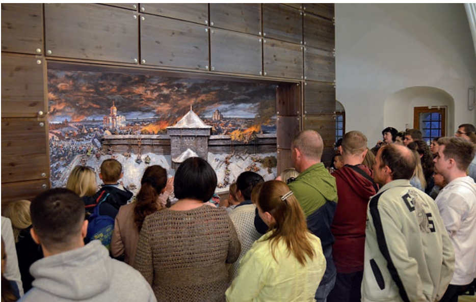
Посетители возле диорамы в экспозиции «От Руси к России»

время диорама представляла собой изображение в перспективе, расположенное в ящике (как в нашем музее). Диорама создает иллюзию реального пространства, что позволяет зрителю почувствовать себя непосредственным участником события. В диораме наибольший масштаб изображения дается в центре, на флангах он уменьшается. Эффект участия в значительной мере зависит от размера диорамы.