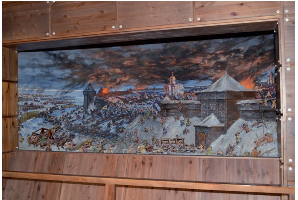
Диорама «Героическая оборона Старой Рязани в декабре 1237 г.»

В этом году диораме «Героическая оборона Старой Рязани в декабре 1237 г.» исполнилось 50 лет. За это время неоднократно менялись концепции оформления музейных залов, но диорама всегда оставалась одним из ярких, знаковых элементов исторической экспозиции. Для посетителей просмотр диорамы – завершающая часть рассказа об истории первой столицы Рязанского княжества. Диорама показывает трагический момент штурма Рязани войском Батыев в декабре 1237 г. после ожесточенной пятидневной осады. Вот как описывает эти события безымянный автор «Повести о разорении Рязани Батыем»: «И стал воевать царь Батый окаянный Рязанскую землю и пошел ко граду Рязани. И осадил град, и бились пять дней неотступно. Батыево войско переменалось, а горожане бесменно бились. И многих горожан убили, а иных ранили, а иные от великих трудов и ран изнемогли. А в шестой день спозаранку пошли поганые на город ... и взяли град Рязань месяца декабря в 21 день. И не осталось во граде ни одного живого: все равно умерли и единую чашу смертную испили ...». Автором диорамы является Народный художник РСФСР Ефим Дешалыт (1921–1996). Художнику удалось передать драматизм момента, когда татаро-монголы прорываются за стены деревянного города, который уже полыхает пожарами. Текст,