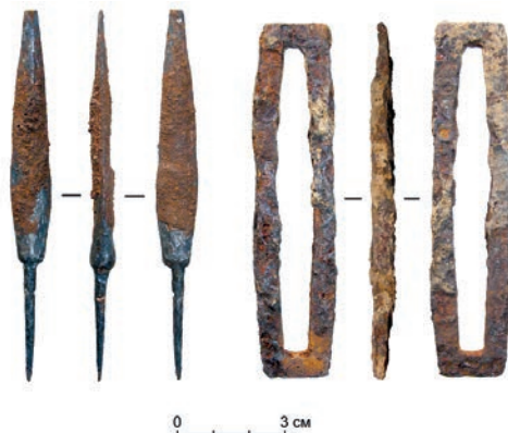
Наконечник стрелы и кресало, XIII–XIV вв.