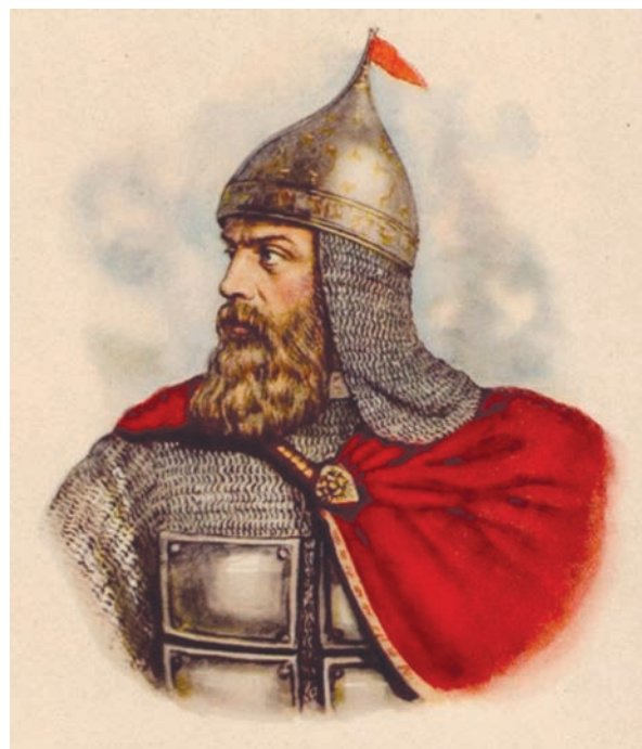
Князь Московский и Владимирский Дмитрий Иванович Донской

Летопись не называет точное место битвы, дается лишь указание «у реки у Вожи в Рязанской земле». Историки XIX в. определяли место сражения 1378 г. в нижнем течении р. Вожи в окрестностях сел Ходынино, Митинское, Перекаль, Недостоево, принимая за памятники Вожской битвы расположенные здесь курганы и древние городища. В кон. XX в. в результате сопоставления письменных источников и косвенных данных, детального изучения исторического ландшафта и анализа результатов археологических исследований археологи И.Л. Черная