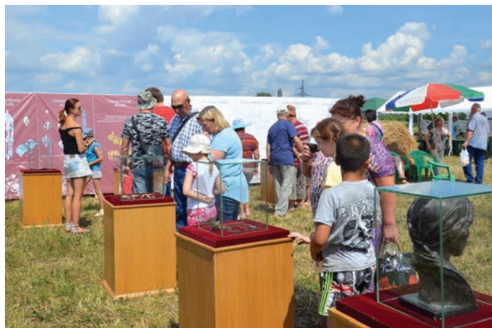
Выставка археологических находок, сделанных на городище