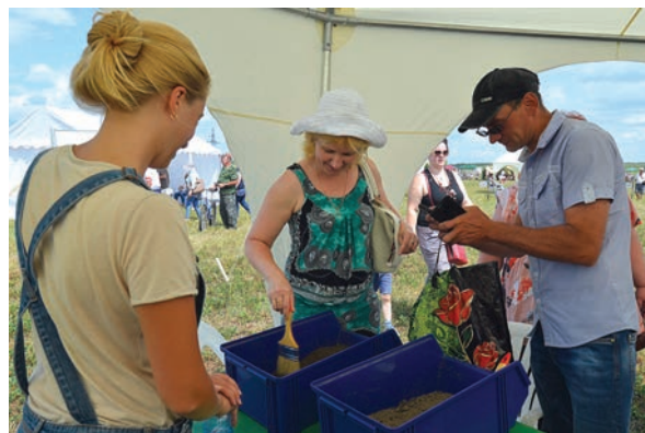
Каждый мог стать археологом, путь и на пять минут