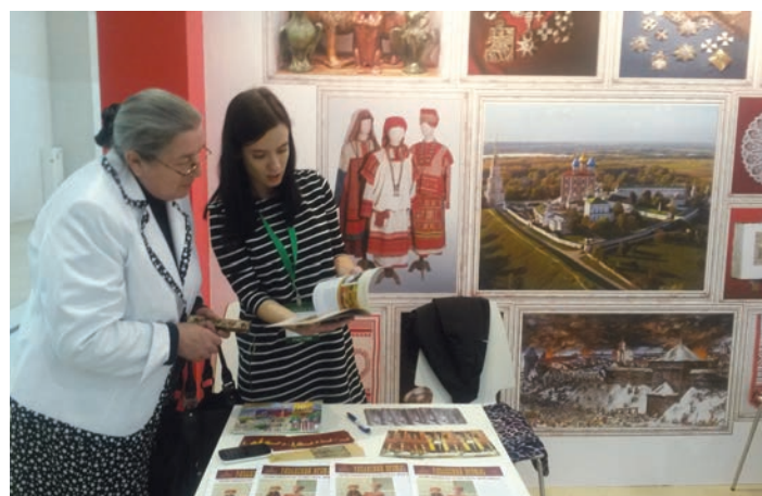
Стенд Рязанского историко-архитектурного музея-заповедника на фестивале «Интермузей-2018»

внимание «Интермузей» всегда уделяет детям. Для них музеи-участники готовят интерактивные программы, научные занятия, арт-проекты, мастер-классы, квесты. Неудивительно, что на «Интермузей» гости приходили целыми семьями! Количество посетителей всех фестивальных площадок, по данным организаторов, составило 47 800.