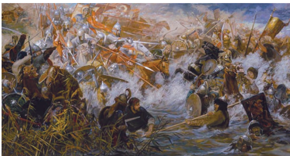
«Битва на реке Воже». Художник Игорь Комов, 2004

Победа русской рати над войском мурзы Бегича нанесла значительный урон военному и политическому престижу Мамай. Битва на Воже знаменовала собой победу новой тактики: смелые действия Дмитрия Донского оказались самым эффективным средством ослабления воли противника к сопротивлению и обеспечили подъем морального духа русского войска. Сражение на р. Воже стало прологом победы на Куликовском поле, которая ознаменовала начало возрождения русского национального государства.