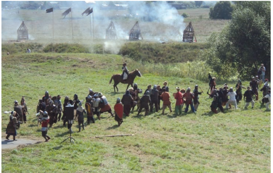
Реконструкция Битвы на Воже на одноименном военно-историческом празднике