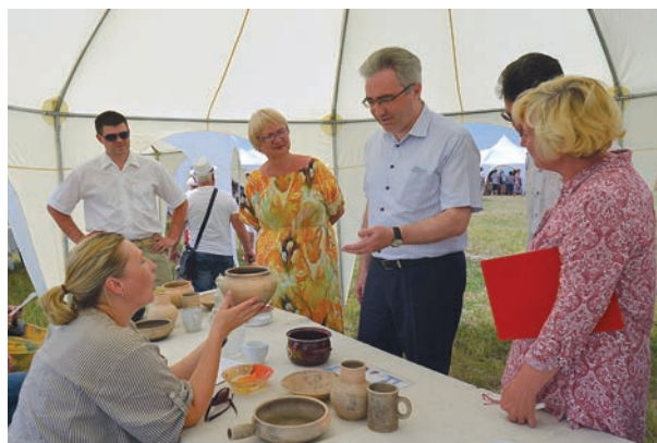
Почётный гость праздника – Министр культуры и туризма региона В.Ю. Попов