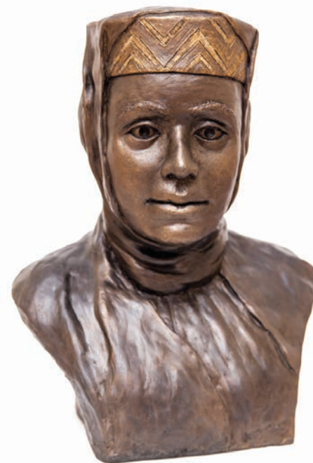
Реконструкция облика жительницы г. Глебов, кон. XII–XIII в.

Во время раскопок ВАЭ было сделано большое количество находок, характеризующих быт и культуру жившего здесь населения: посуда, ножи, замки, ключи, кресала, точильные и кресальные камни, древнерусская свинцовая пломба, подковы и подковные гвозди, фрагменты жерновов, монеты. Из предметов личной гигиены были найдены фрагменты костяных гребней и копоушка. Предметы вооружения и снаряжение воинов представлены наконечниками