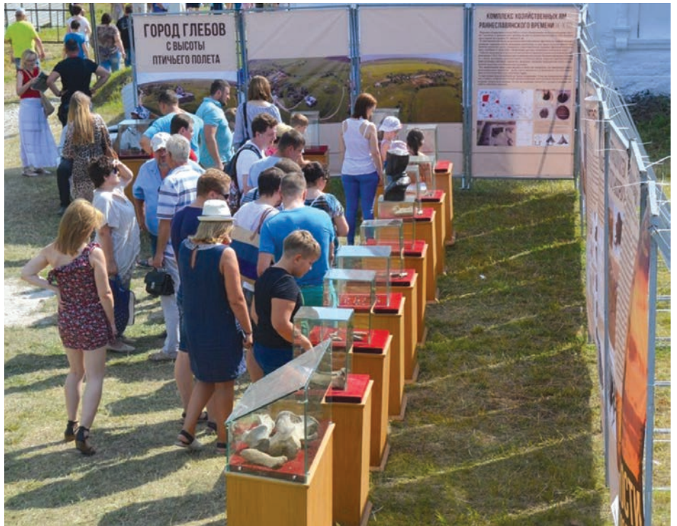
Выставка находок ВАЭ на празднике «Битва на Воже»

Увидеть самые интересные находки Вожской археологической экспедиции можно на экспресс-выставках, которые музей-заповедник ежегодно организует на межрегиональном военно-историческом фестивале «Битва на Воже».