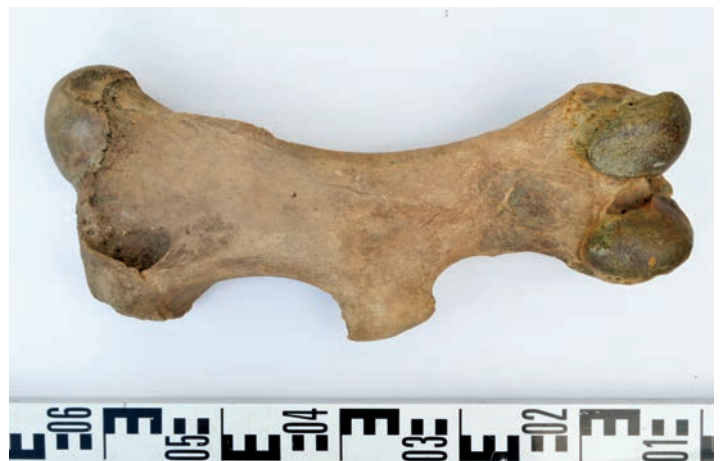
Бедренная кость шерстистого носорога