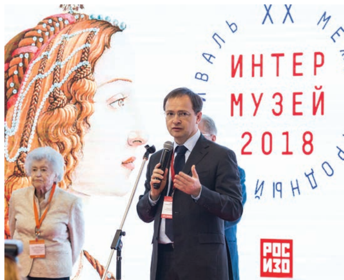
Министр культуры РФ В.Р. Мединский и председатель жюри фестиваля И.А. Антонова на открытии «Интермузея-2018»

Все дни на главной сцене фестиваля для посетителей шли мероприятия культурной программы. Сменяли друг друга джазовые, эстрадные и народные исполнители. Можно было стать участником дискуссии, посмотреть мюзикл, фильм или хореографический концерт. Особое