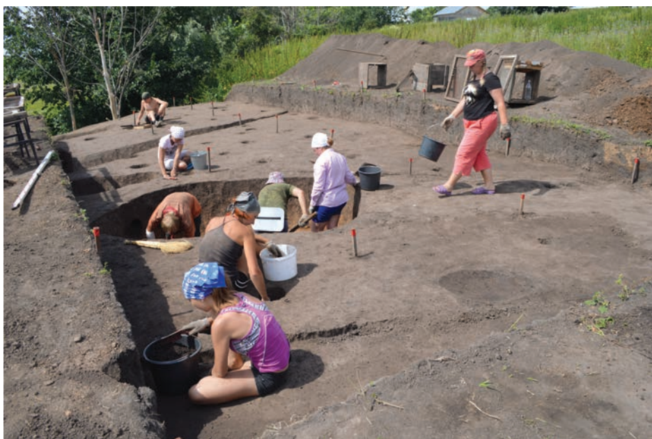
Работа Вожской археологической экспедиции

В отдельную группу археологи выделяют находки, связанные с ювелирным производством. Так, находки заготовок каменных крестиков могут свидетельствовать в пользу того, что в древнем Глебова в XIII–XIV вв. могли существовать многопрофильные ремесленные мастерские по изго-