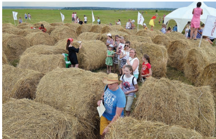
Впервые на празднике работал исторический лабиринт «Евпатий Коловрат»