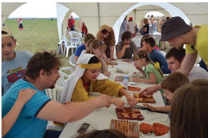
На интерактивной площадке «Делу – время, потехе – час» шла азартная игра в средневековые настольные игры

14 июля на городище Старая Рязань (Спасский район) состоялся одноименный праздник. Организатором мероприятия выступил Рязанский историко-архитектурный музей-заповедник, в ведении которого находится городище. Тема праздника этого года – «Археологи открывают тайны». Он был посвящен всем исследователям Старой Рязани.