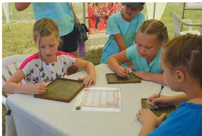
Гости праздника могли совершить путешествие в прошлое, почувствовать себя жителями древней Рязани и даже оставить свои письма на восковой дощечке