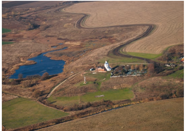
Достопримечательное место «Поле Вожской битвы» с высоты птичьего полета

С 2010 г. в структуру Рязанского историко-архитектурного музея-заповедника было передано городище города Глебова XII в., в этом же году была сформирована Вожская археологическая экспедиция, для руководства которой в 2011 г. в музее создан отдельный сектор. В настоящий момент на городище установлен особый охранный режим, предусматривающий защиту от любых посягательств, которые могут негативным образом сказаться на сохранности памятников истории и культуры; размещены