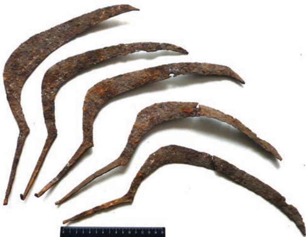
Клад серпов, XIII в.