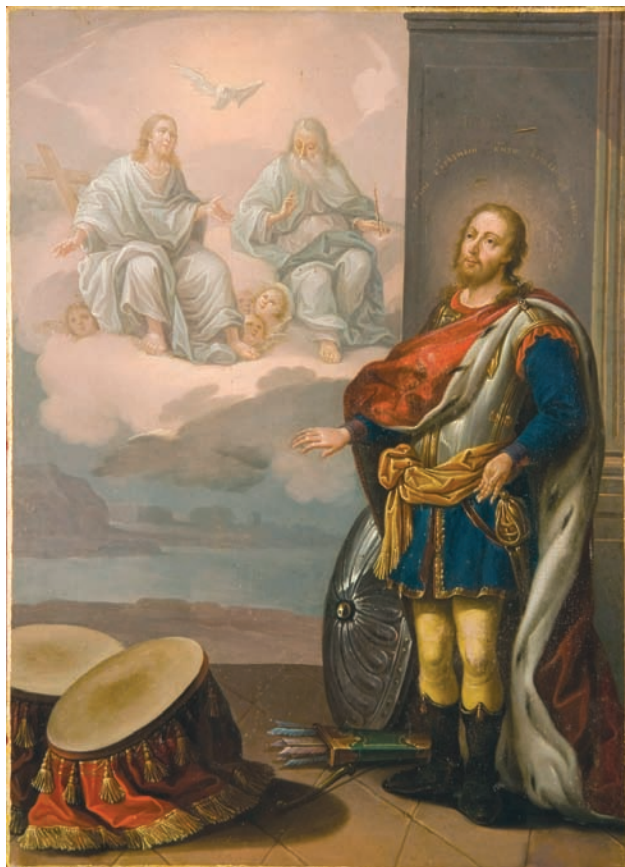
Икона «Св. Александр Невский». 1807 г. Дар архиепископа Курского и Белгородского Феоктиста графу А.Г. Орлову-Чесменскому.

Иллюстративный материал выставки – графические работы народного художника России, кавалера ордена Почёта Алексея Дмитриевича Шмарина. Его эпическая серия «Герои русского народа XIII–XV веков», созданная в 1968–1969 гг., сегодня