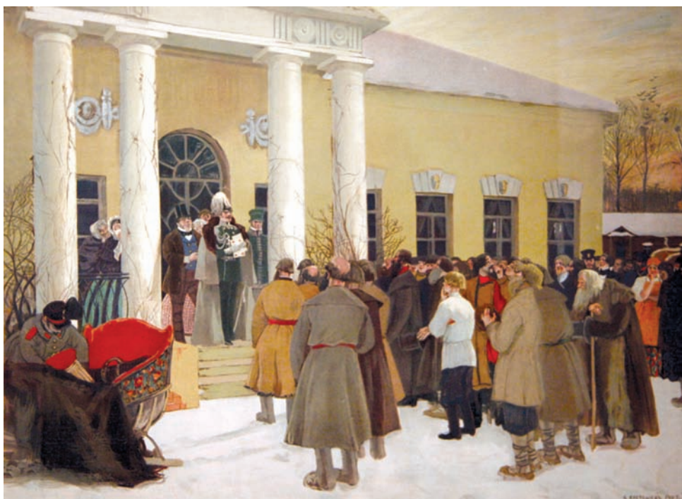
Б. Кустодиев. Чтение манифеста (Освобождение крестьян)

В марте в Рязанском историко-архитектурном музее-заповеднике откроется выставка, приуроченная к памятной дате российской истории. В числе экспонатов будут показаны документы и портреты государственных деятелей времен отмены крепостного права, предметы крестьянского быта и страшные артефакты прошлого – орудия пытки, применявшиеся к крестьянам (рогатка и двушейные цепи).