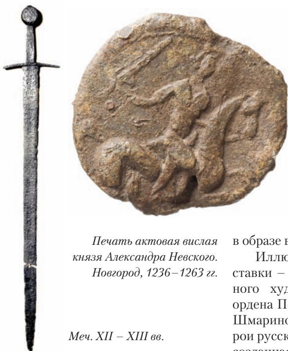
Печать актовая вислая князя Александра Невского. Новгород, 1236–1263 гг.

Материалы предоставлены ФГБУК «Новгородский государственный объединенный музей-заповедник».