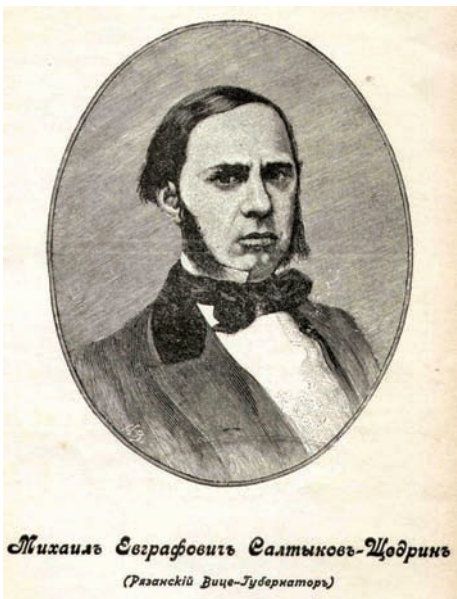
Михаил Евграфович Салтыков-Щедрин (Рязанский Вице-Губернатор)

27 января исполнилось 190 лет со дня рождения знаменитого русского писателя-сатирика М.Е. Салтыкова (литературный псевдоним – Николай Щедрин). Он родился в Тверской губернии, в старинной дворянской семье, окончив учебу в Царскосельском лицее, начал службу чиновником в столице. После появления повести «Запутанное дело», написанной под литературным влиянием произведений Н.В. Гоголя и Ф.М. Достоевского, Салтыков «за вольнодумие» был переведен на службу в Вятку. По возвращении из ссылки в 1856 г. молодой литератор начинает публикацию знаменитых «Губернских очерков» и неожиданно для всех в 1858 г. полу-