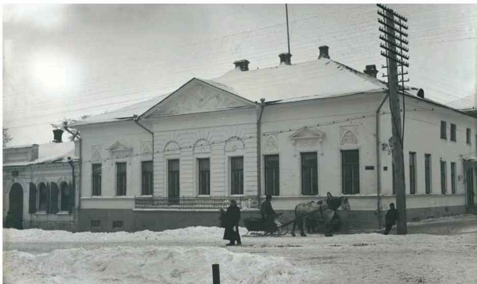
Дом на ул. Астраханской, который снимал М.Е. Салтыков-Щедрин в 1858-1860 гг.