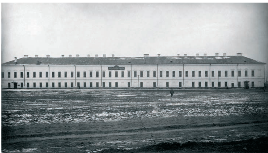
Здание губернских присутственных мест на Соборной площади

Салтыков проводит ревизию и реформу делопроизводства Губернского правления, чистит его личный состав от недобросовестных и малограмотных чиновников. Помимо исполнения непосредственных служебных обязанностей Салтыков также являлся членом Статистического комитета, Попечительного совета рязанской публичной библиотеки, вице-директором Попечительного совета о тюрьмах. Особо стоит отметить его работу по общему руководству газетой «Рязанские губернские ведомости», в которой с его приходом начали регулярно появляться статьи и материалы по вопросу предстоящей отмены крепостного права.